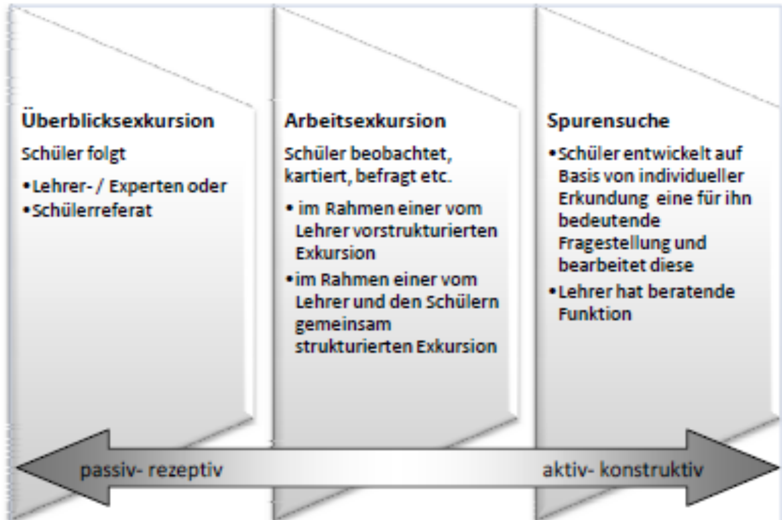
Abb.1: Klassifikation von Schüler/innenexkursionen nach dem Grad der Selbstorganisation (Lößner, 2011, S. 13)