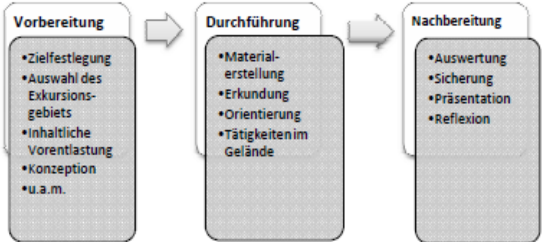
Abb.2: Klassifikation von Schüler/innenexkursionen nach dem Grad der Selbstorganisation (Lößner, 2011, S. 13)

(nach Rinschede 2005, 244f und Meyer 2006, S. 135)