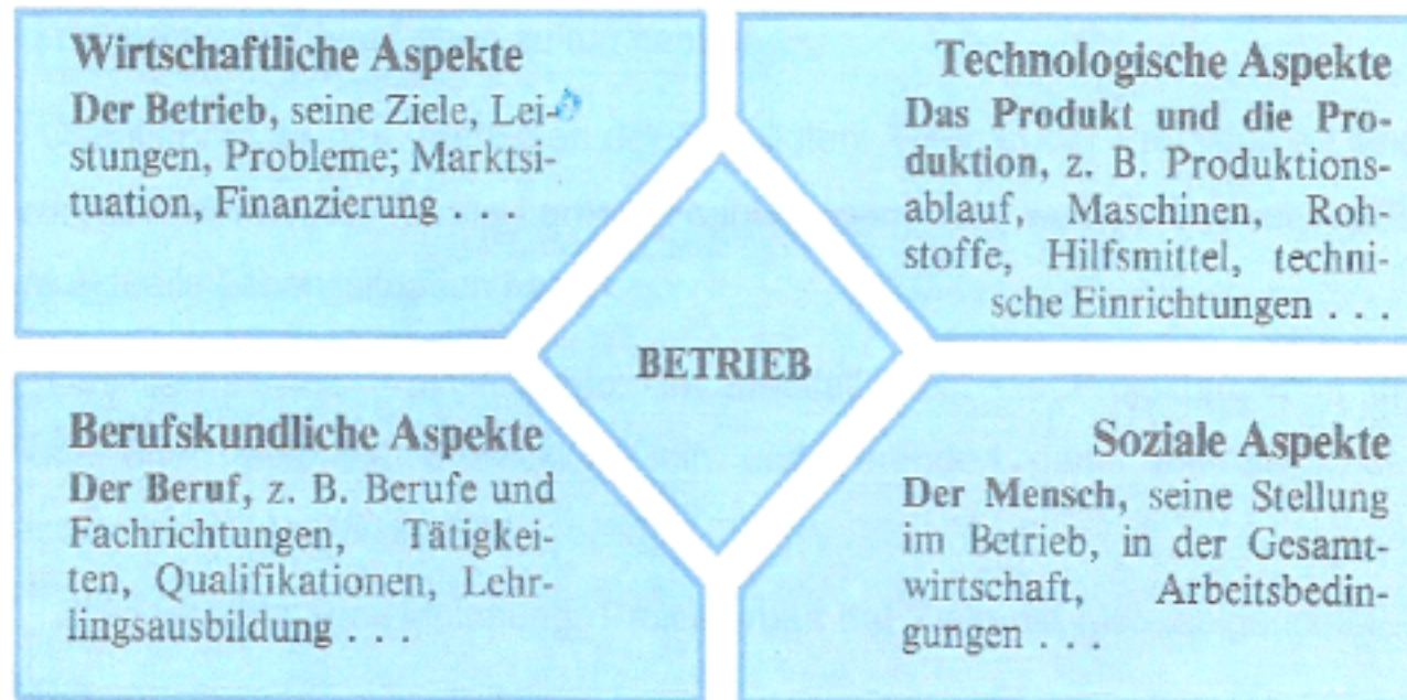
Abb. 2: Betriebserkundung nach verschiedenen Aspekten (Mrkvicka 1987. S. 6)