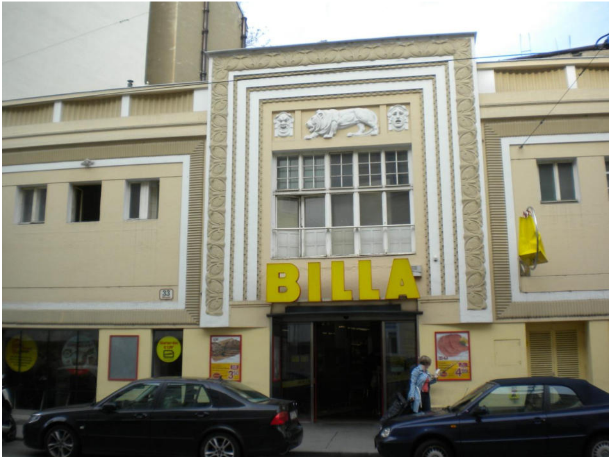
Was war das VORHER ?