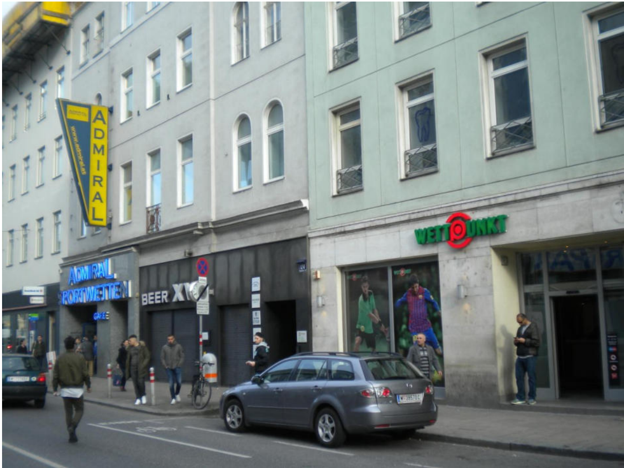
Soziale Viertelsgliederung - wo gibt es eine solche Häufung ? >>> 1050 Wien u 1150