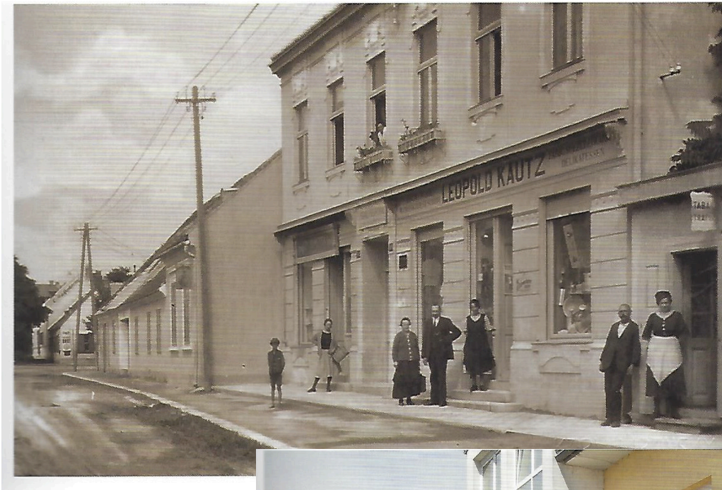
Wohnhaus, Trafik, 2017