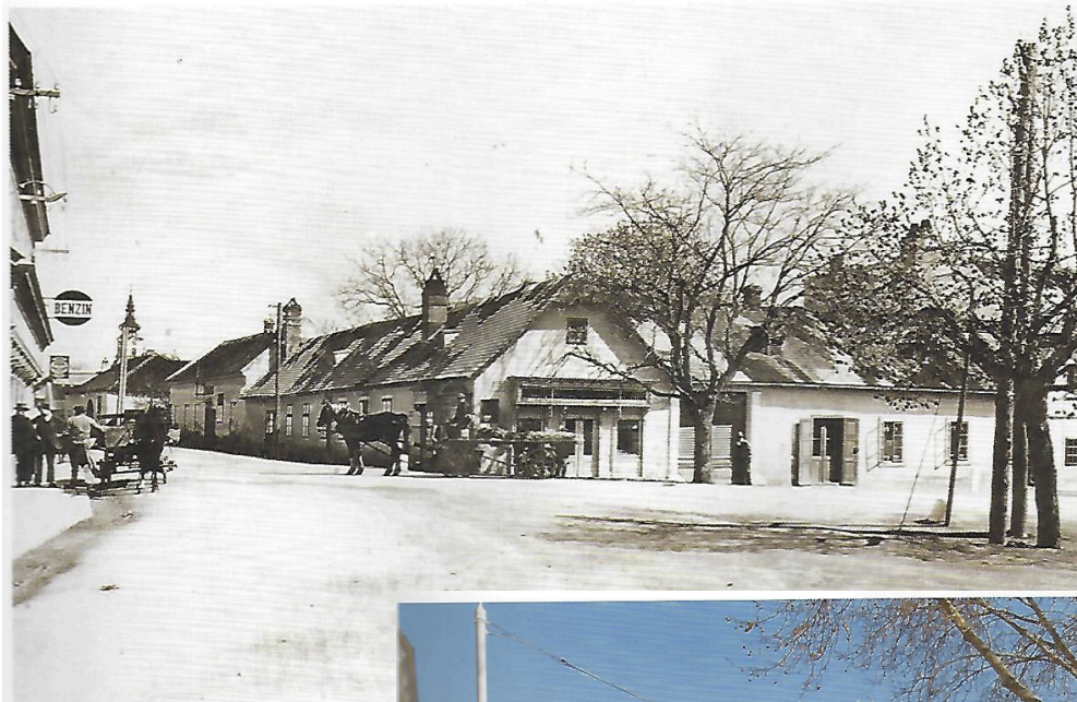
Einrichtungshaus Gaster; 2017