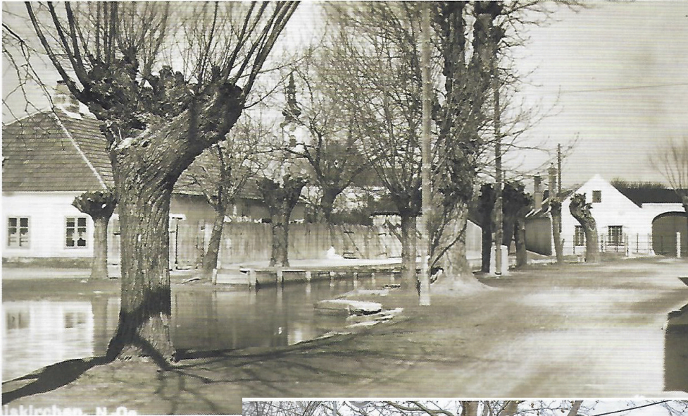
Mühlbachgasse, mit Brücke (Auto und Fußgänger)

Mühlbachgasse im Jahr 1928; Im Hintergrund einer der letzten typischen fränkischen Dreiseithöfe in unserer Region.