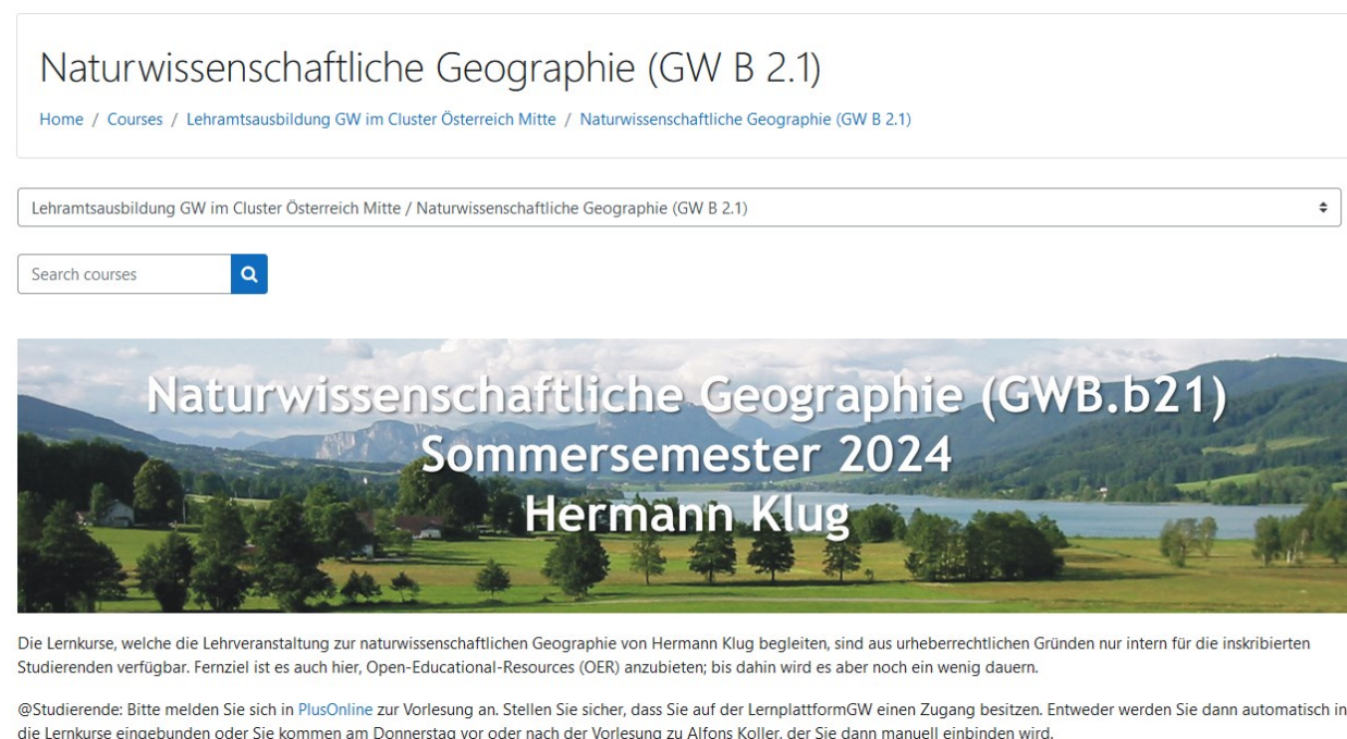
Abbildung 2: Die Moodle Lernplattform mit den Lehrveranstaltungsmaterialien

Sämtliche Materialien und Informationen zur Lehrveranstaltung befinden sich auf der Moodle LernplattformGW im Cluster Österreich-Mitte (Abbildung 2). Die Materialien sind über den am Anfang des Studiums beantragten Moodle Zugang frei verfügbar 2 .