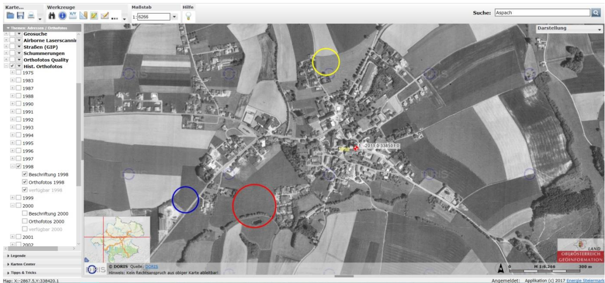
Screenshot: Orthofoto 1998 (Aspach)

Unterschiede lassen sich beispielsweise zwischen den Orthofotos von 1998 und 2000 feststellen, mit dem Bau des Gesundheitszentrums „Revital Aspach“ (rot gekennzeichnet), dem Bau einer „Spar“ Filiale (blau gekennzeichnet) und die Errichtung von Wohnblocks (gelb gekennzeichnet).