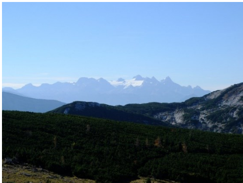
Abb. 1: Blick vom Feuerkogel Richtung Süden zum Hohen Dachstein ( Kuschnigg 2016 )

Dieser Lehrausgang findet bei jeder Witterung statt; das Programm wird an die Witterung angepasst.