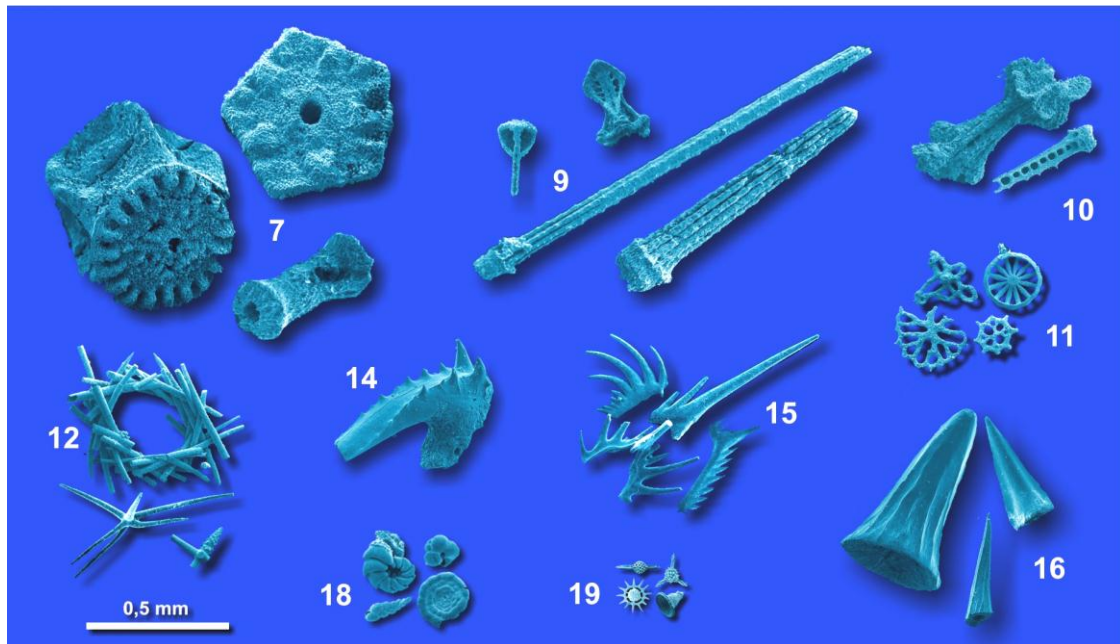
Abb. 3b: Mikroskopisch kleine fossile Reste kleiner und großer Meeresbewohner. Zahlen siehe Text.

Von den Wirbeltieren des Hallstatt-Meeres kennen wir nur verschiedengestaltige, nadelspitze und kegelig stumpfe Zähne von Fischen (16), die auf verschiedene Ernährungsweisen schließen lassen. Und nicht zu vergessen sind die größten, aber seltensten Bewohner dieser Tiefen, die Fischsaurier (17). Vor einigen Jahren wurden Knochenreste eines derartigen, mehrere Meter langen Tieres im Raum Hallein-Berchtesgaden gefunden. Eine Rekonstruktion davon ist im Museum von Golling/Abtenau ausgestellt.