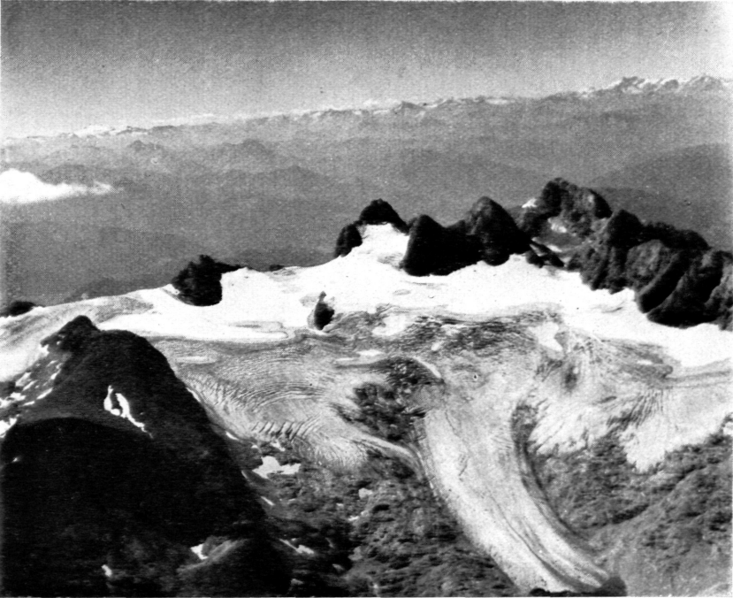
Abb. 1: Hallstätter Gletscher im Sommer 1951. Schneegrenze in 2600 m Höhe. Die Ablation hat weite Teile des Gletschers erfaßt.