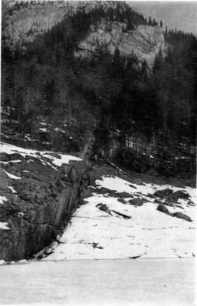
Abb. 3: Hinterer Gosausee mit Eisdecke; 2. April 1953, Pegel 1120, 75 m. Der Harnisch ist nur bei winterlichem Tiefstand sichtbar. Beginn der Kogelgasse rechts oben.