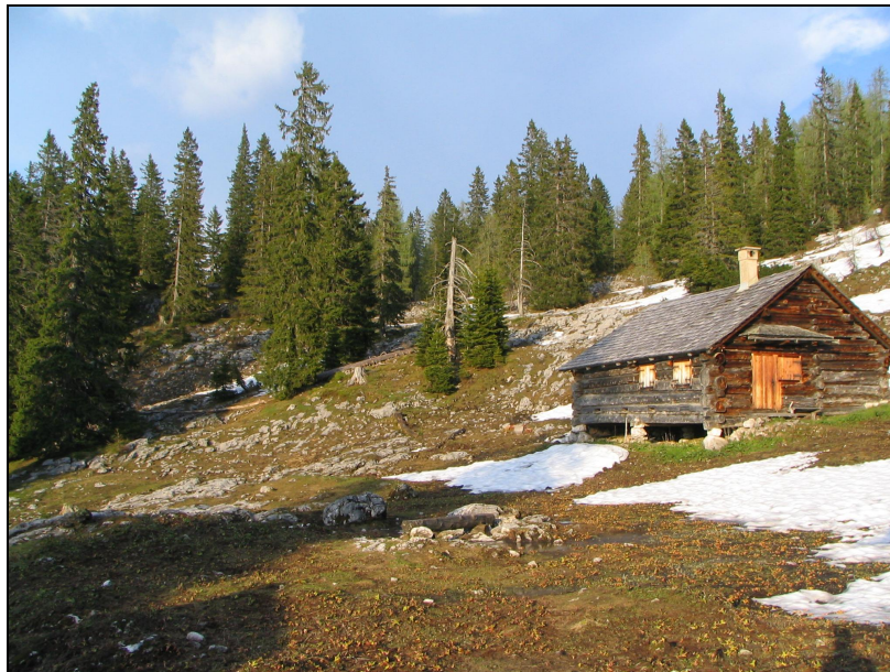
Abbildung 3 und 4: Probefläche Seekaralm: Lichter Nadelmischwald aus Fichte und Lärche (selten Zirbe) (oben). Auch Freiflächen wie hier um die Seekaralm sind eingestreut.