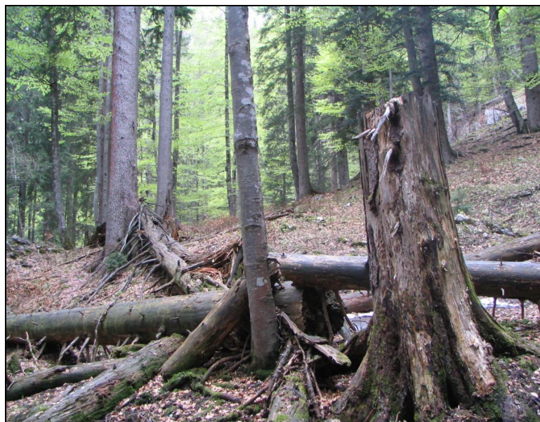
Abbildung 1 und 2: Probefläche Gosauseen. Vordere und Hinterer Gosausee vom Aufstieg zur Adamekhütte aus gesehen (oben). Naturwaldreservat Kogelgassenwald mit hohem Totholzreichtum beim Hinteren Gosausee.