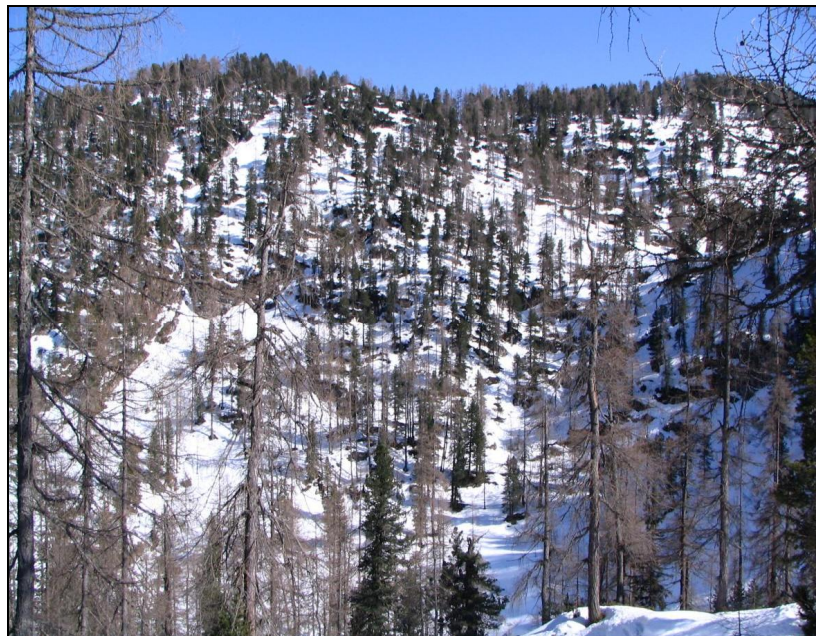
Abbildung 5 und 6: Probefläche Arikögele. Auch hier dominiert aufgelockerter Nadelmischwald mit Lärche, Fichte und Zirbe; im oberen Bereich befinden sich größere Latschenflächen. Im Unterschied zur angrenzenden Probefläche Seekaralm sind wesentliche Teile der Fläche steil und felsig.