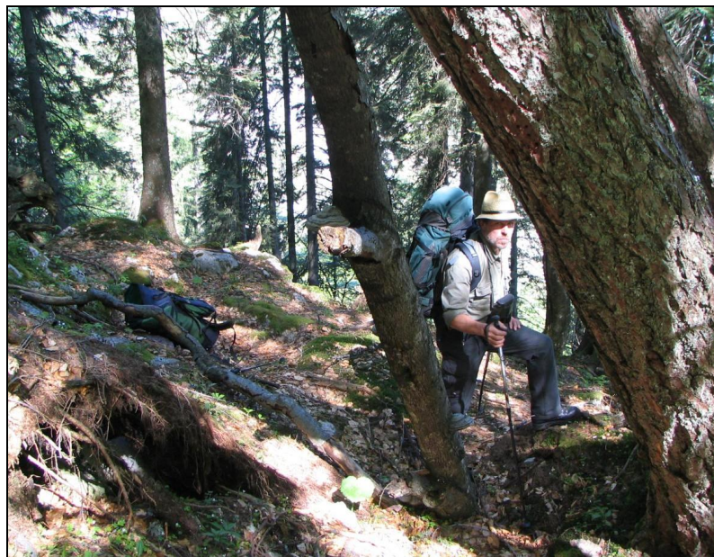
Abbildung 10 und 11: Die Probefläche Schönbergalm wird im oberen Bereich ebenfalls von Lärchen und Fichten dominiert. Sie ist über die Krippensteinseilbahn leicht erreichbar (Seilbahnstation etwa im Mittelpunkt des Bildes oben). Unterhalb der Schönbergalm stocken laubholzreiche Mischwälder in steilem Gelände. Hier brütet u.a. der Weißrückenspecht.