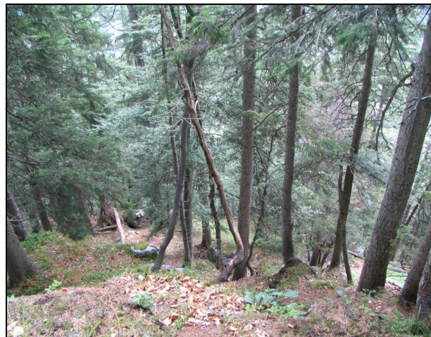
Abbildung 7 bis 9: Die Probestfläche Krippenbrunn umspannt eine weite Höhenamplitude von ca. 750m bis 1750m. Dementsprechend heterogen sind auch die Waldtypen. Oben: Am Schönbüchel stockt lichter Lärchen-Zirben-Wald (Lebensraum des Raufußkauzes). Mitte: Unterhalb von Krippenbrunn ist die Schipiste ein markanter Einschnitt. Trotzdem befinden sich hier im Nadelmischwald zahlreiche Reviere von Dreizehen-, Bunt-, Grau- und Schwarzspecht. Unten: Die buchenreichen Steilhänge am Schafeckkogel beherbergen Reviere von Weißrücken-, Dreizehen- und Grauspecht.