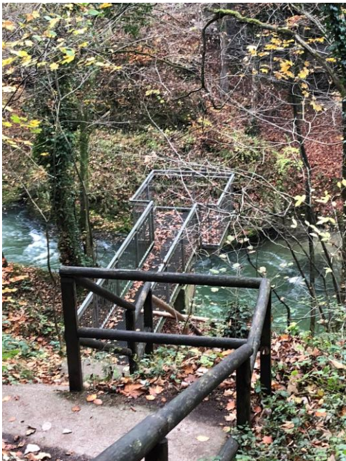
Abb. 8 – Aussichtspunkt