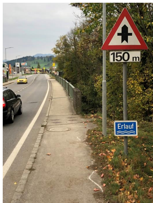
Abb. 9 – Brücke Bundesstraße 25