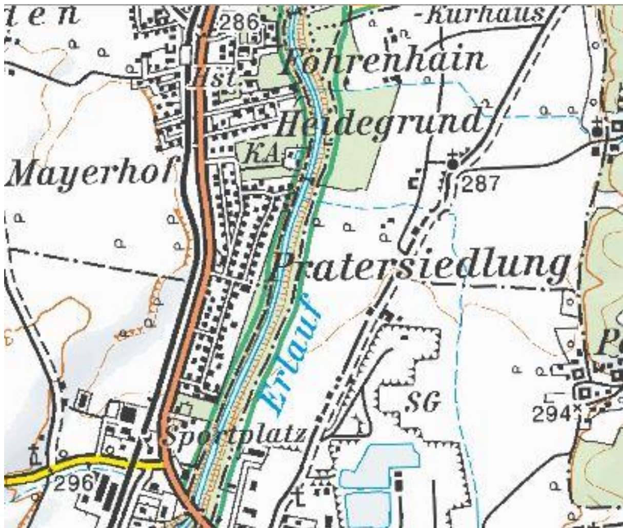
Abb. 10 – Abbildung der Wanderung auf der ÖK 50 ( http://www.austrianmap.at )