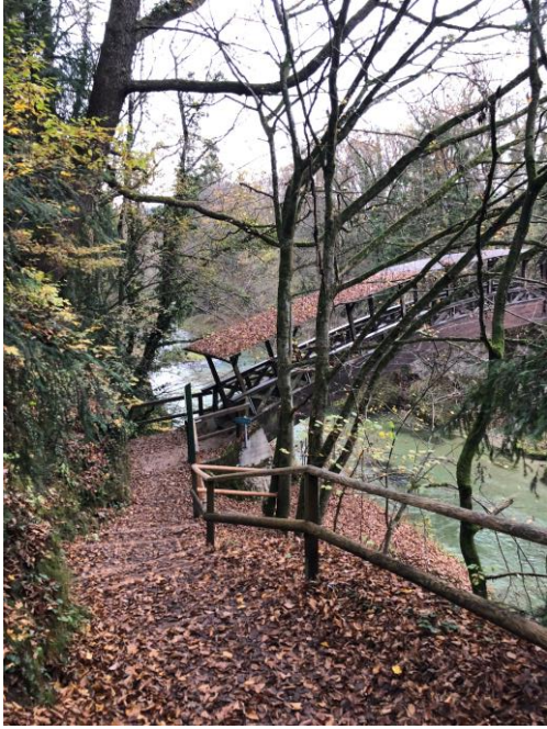
Abb. 6 – Holzsteg