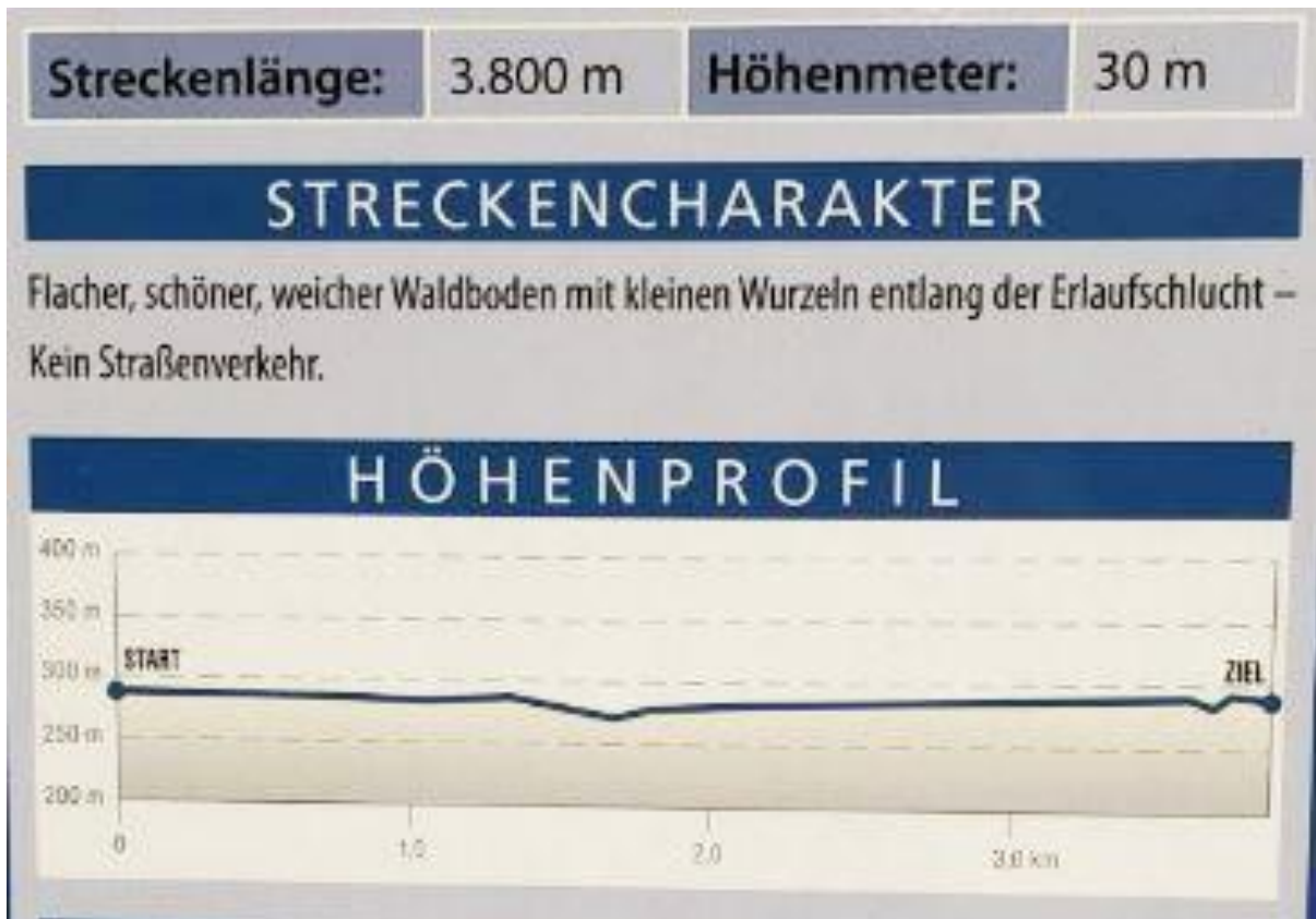
Abb. 3 – Höhenprofil (Anm.: Da der Höhenunterschied nur sehr gering war, konnte dieser mittels Google Earth nicht angezeigt werden. Deshalb wurde zur Veranschaulichung ein Foto von der Wegbeschreibung vor Ort angefertigt)