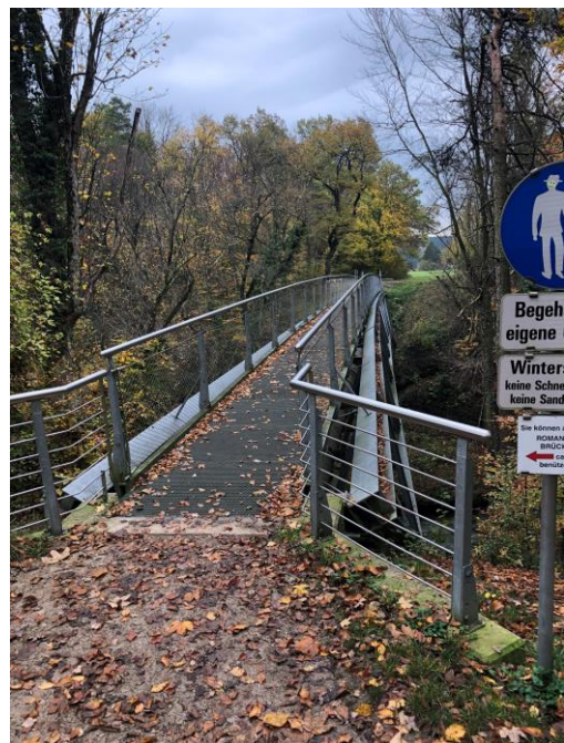
Abb. 5 - Metallsteg