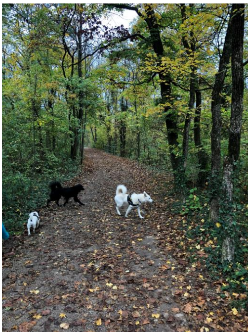
Abb. 4 – Waldpfad