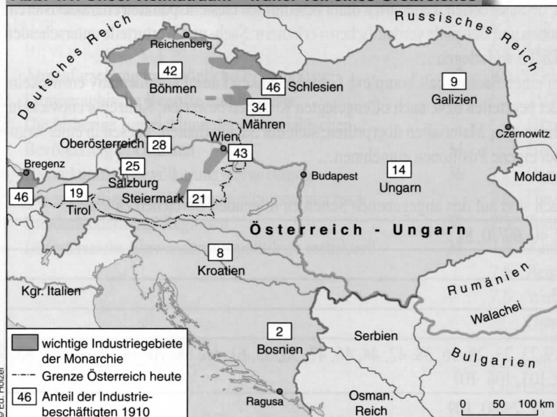
Abb. 4.1: Unser Heimatraum – früher Teil eines Großreiches