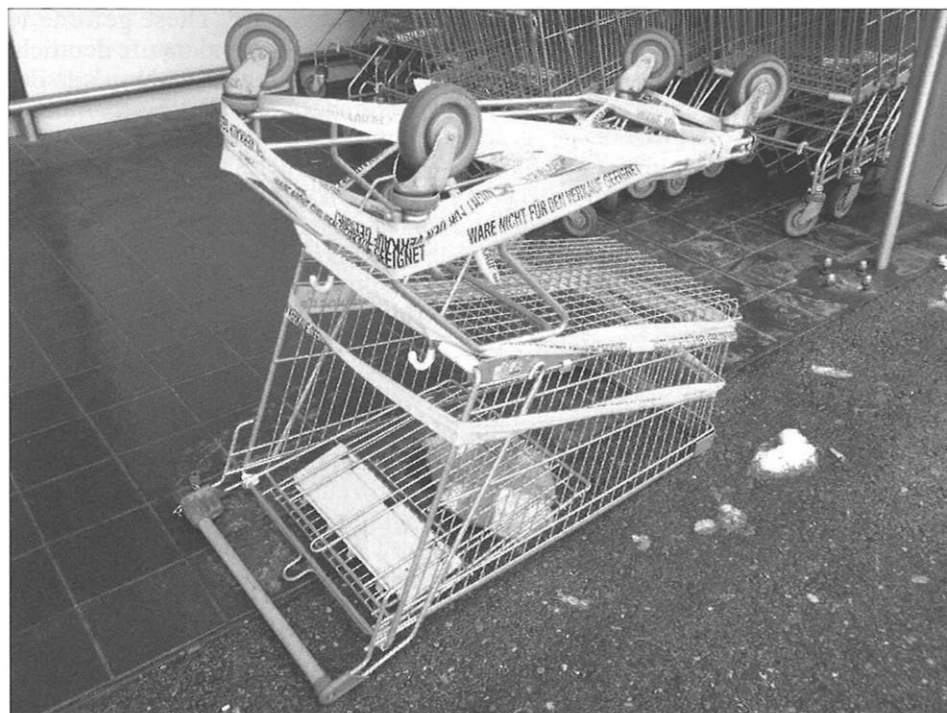
Übersicht 1: Reflexions- und Handlungsfähigkeit von jungen Menschen ist in unseren ökonomisch geprägten Lebenswelten erforderlich, um „Unfälle“ im Alltagsleben zu vermeiden.

Wirtschaftswissen ist wichtig, doch Wirtschaftswissen allein ist zu wenig (Fridrich 2012). Aber welches Wirtschaftswissen benötigen junge Menschen? In diesem Kapitel wird diese Frage zunächst negativ beantwortet, welches Wirtschaftswissen aus der Sicht der GW-Fachdidaktik nicht besonders förderlich für wirtschaftlich „erfolgreiche“ Handlungen im außerschulischen Alltag in Haushalt, Konsum, Arbeitswelt und Gesellschaft ist – doch von diesen mündigen Handlungen ist als Leitbild an allgemeinbildenden Schulen auszugehen. Dazu ein Beispiel: Für mündige, verantwortungsbewusste Konsumhandlungen ohne „Entgleisungen der Konsum- und Wegewerfgesellschaft“ oder „Unfälle“ – wie etwa rücksichtslose und inadäquate Handlungen (siehe dazu die überpointierte Darstellung in Übersicht 1) – ist Wissen zwar nötig, aber alleine nicht ausreichend, weil zwischen theoretischen Wissensbeständen und alltäglichen, lebensweltlichen Handlungen nicht selten große Differenzen bestehen. Im Folgenden sollen sogenannte Wirt-