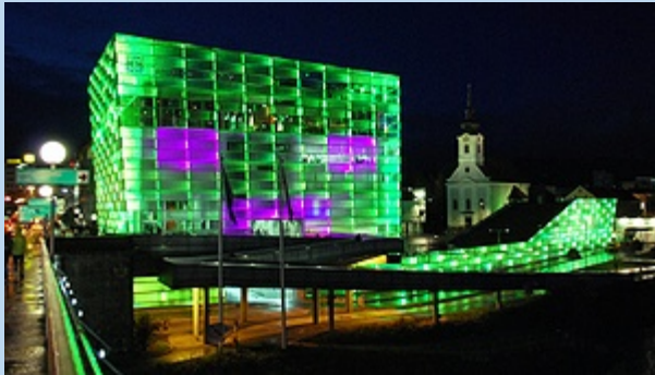
Abb. 1: AEC Linz (Wirth, o.J.)

Angabe des Titels bzw. der Bezeichnung, was dargestellt ist incl. Quellenangabe mit fortlaufender Nummerierung.