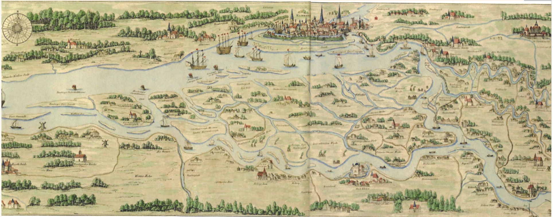
Hamburger Elbregion nach einer Karte von Melchior Lorich (1567)