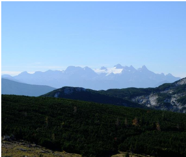
Abb. 1: Blick vom Feuerkogel Richtung Süden zum Hohen Dachstein (Kuschnigg 2016)