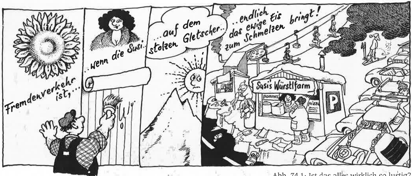
Abb. 74.1: Ist das alles wirklich so lustig?