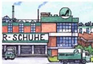
Betrieb: Produktion Dieser Betrieb versorgt