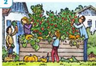
Haushalt: Produktion und Konsum Dieser Haushalt versorgt