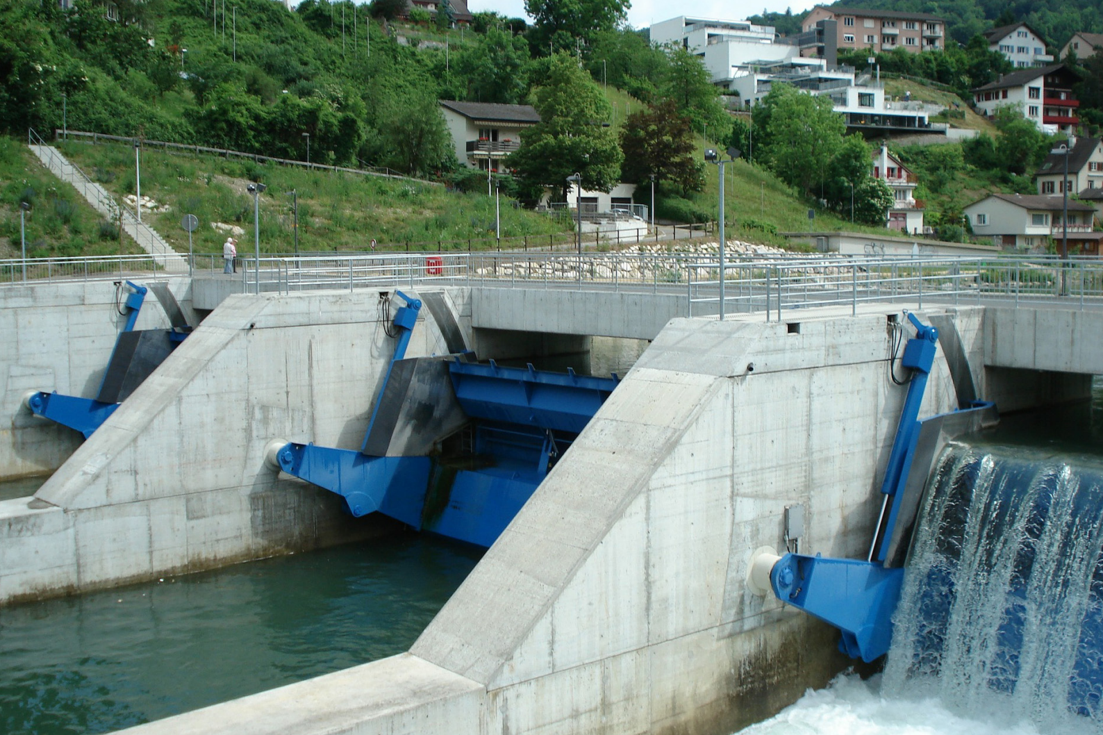
Abbildung: Wasserkraftwerk in Baden