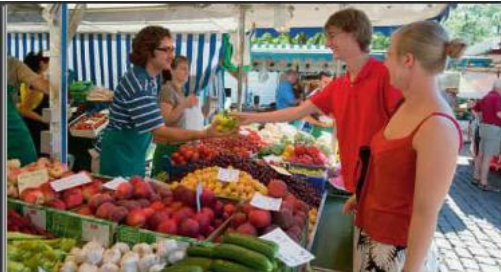
M1 Wochenmarktstand A