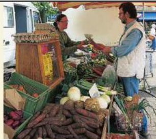
M3 Wochenmarktstand B