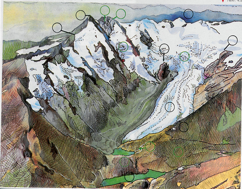
▼ Abb. 4.2