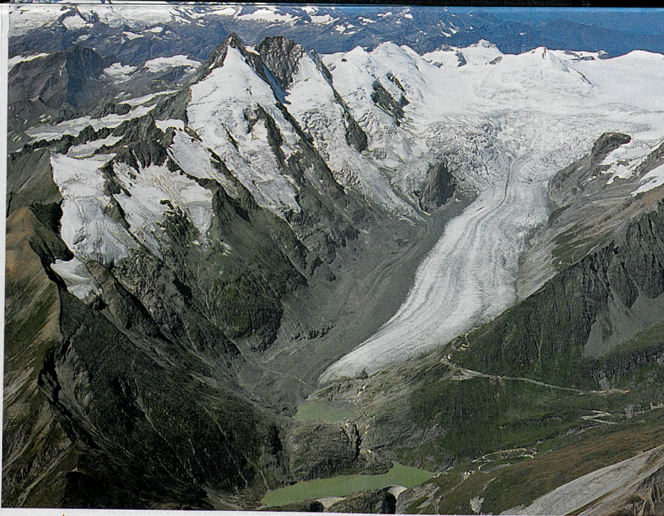
▲ Abb. 4.1: Pasterze und Großglockner