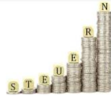
Steuern: unbeliebt, aber notwendig?