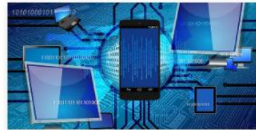
Krypto-Assets: Bitcoin, Blockchain & Co