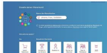
Inflation verstehen: die PIA-App der OeNB