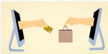
Digitalisierung: Auswirkungen auf Kaufverhalten und Umgang mit Geld