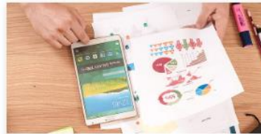
(M)eine Gemeinde: Wofür gibt sie Geld aus?