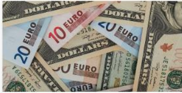
Währungsunion: Chancen und Grenzen aus persönlicher Sicht