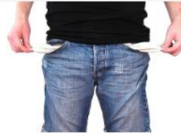
Überschuldung: Umgang mit Geld