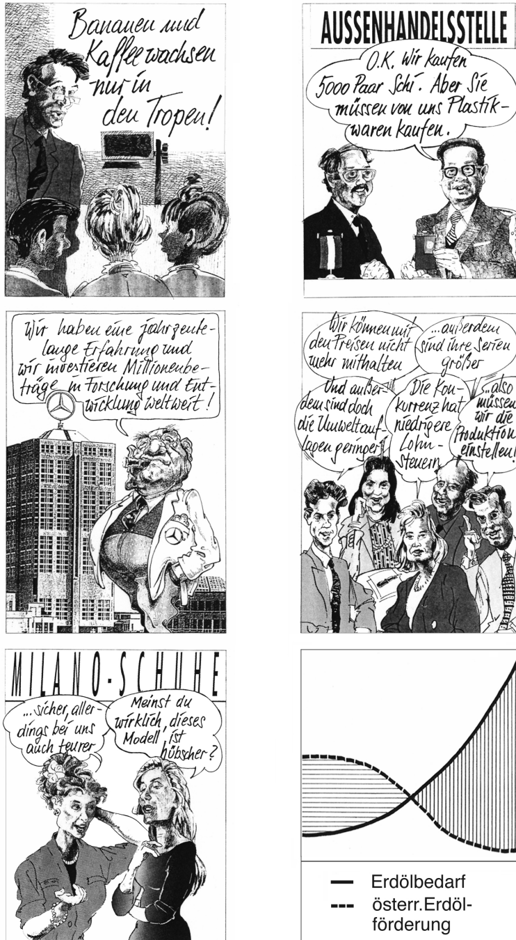
Abb. 2: Beispiele für leicht und schwierig auszuwertende Bilder zur Erarbeitung von Ziel 2 der Unterrichtseinheit im Rahmen der inneren Differenzierung