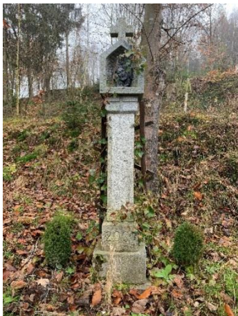
Abbildung 3 Bildstock

und man ein Waldgebiet betritt, befindet sich der zweite Point of Interest auf meiner Route. Ein religiös begründeter Bildstock (Abbildung 3). Von hier gehe ich weiter Richtung Osten. Auf