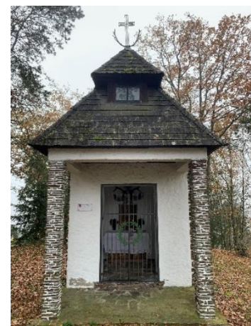
Abbildung 2 Hubertuskapelle

Abbildung 4 veranschaulicht den Sachverhalt für besseres Verständnis. Man sieht, wo die Hubertuskapelle eingezeichnet ist, und der gelbe Stern markiert jene Stelle, wo sie wirklich erbaut wurde. Die blauen Punkte zeigen die drei Points of Interest. Von der Kapelle gehe ich wieder gerade Richtung Osten zurück bis zur Straße. Dort wende ich rechts und gehe die Siedlung entlang bis zu meinem Elternhaus zurück. Dabei lege ich auch wieder ungefähr denselben Höhenunterschied wie zuvor zurück.