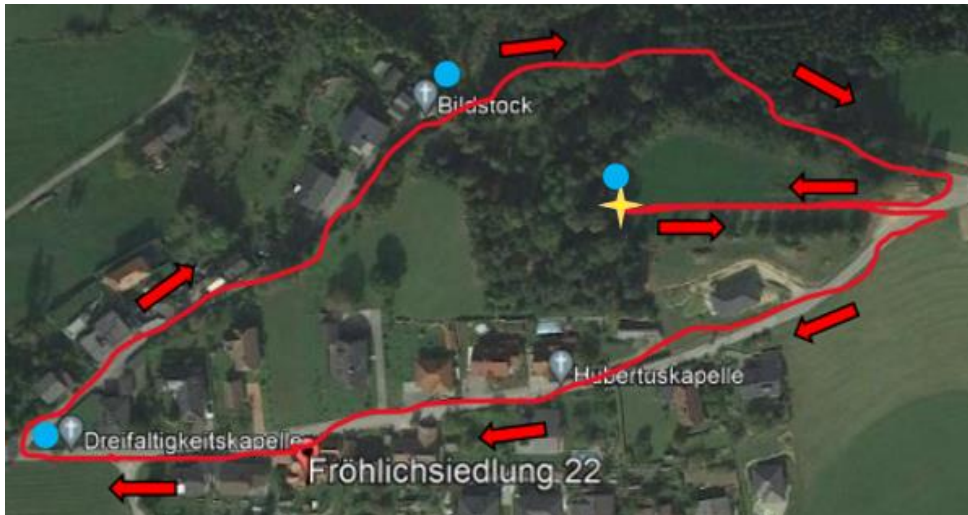
Abbildung 5 Lokation Hubertuskapelle - handgezeichneter Weg