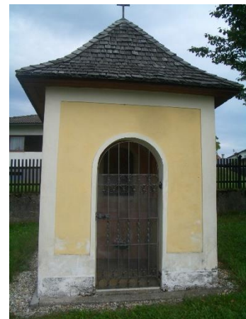
Abbildung 4 Dreifaltigkeitskapelle

Der Start-, sowie auch Endpunkt der kurzen Wanderung ist meine persönliche Wohnadresse. Fröhlichsiedlung 22, 42 83 Bad Zell. Die genauen Koordinaten meines Elternhauses belaufen sich laut Google Earth Pro (Desktopversion) auf 48°21'11,65" N und 14°40'45,59" O. Von hier aus bewege ich mich zu Beginn in Richtung Westen. Am Ende der Siedlung angelangt, befindet sich auf der rechten Seite bereits der erste Point of Interest, die Dreifaltigkeitskapelle (Abbildung 4). Dort angelangt biege ich rechts ab, in Richtung Norden/Nordosten und gehe in dieser Siedlung bis ans Ende der Straße. Dort wo der Forstweg beginnt