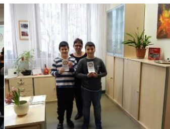
Danksagung der Direktorin