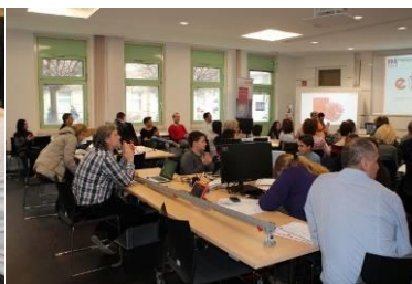
eBazar im Überblick