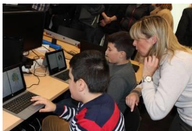
Präsentation durch zwei Schüler